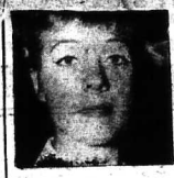
Julie Andress trong phim «Mélodie du bonheur»

do Julie Andress thủ vai chính đã vượt khỏi phim «Autant en emporte le vent»