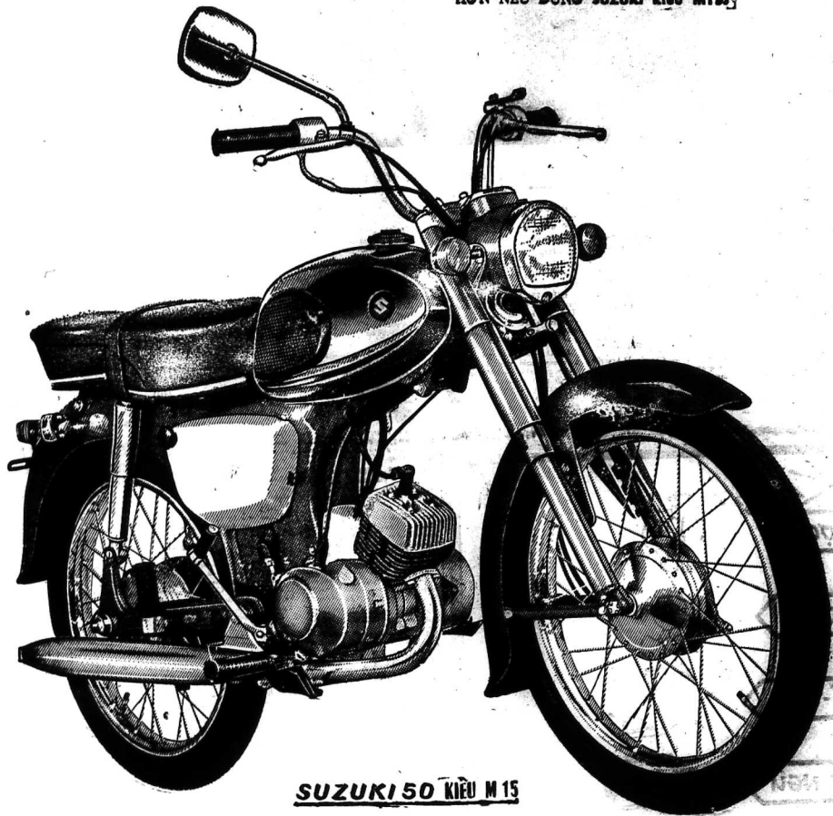
SUZUKI 50 KIỂU M 15

ĐƯỜNG XÀU CÁCH NÀO CŨNG KHÔNG LÀM HƯ ĐƯỢC MÁY. RẤT ÍT HAO SĂNG; 1 LÍT SĂNG CHẠY ĐƯỢC 75 CÂY SỎ. QUÝ VỊ ĐI LÀM CÔNG VIỆC MAU HƠN NẾU DÙNG SUZUKI KIỂU M 15.