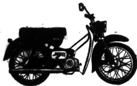
SUZUKI 50 KIỂU M30

Quý Ông và Quý Bà đều dùng được kiểu xe xinh đẹp này. It lưu dùng không thể tưởng tượng được, chỉ có một lít mà chạy được 95 cây số.