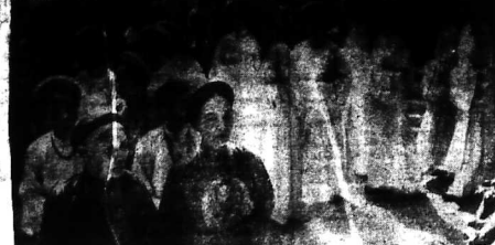
Quang cảnh lễ kỷ niệm hai Bà Trưng tại Hội Phố gần Bến G. Đình.

1 chiến hạm Mỹ chờ dãn dàn và được TREN ĐƯỜNG SANG V.N NORFOLK Virginia 16.3 (AP) - Một chiến hạm của Hải Quân Mỹ đang chờ đợi để được gửi sang Việt Nam.