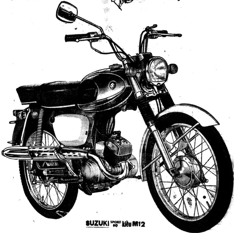
SUZUKI SPORT 50 kiểu M12

Quý vị sẽ thích thú nét thể thao của xe này và sự ít hao sáng của nó.