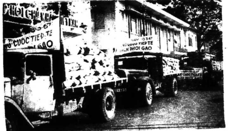
Đoàn xe của Tổng cục Tiếp tế chở gạo đến các quận trong Đà thành để bán lại cho dân chúng với giá chính thức.