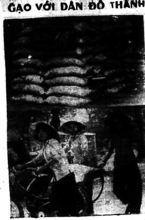
HÌNH TRÊN: Một hội đồng ban gạo nhận công do Tổng cục Tiếp tế cấp cho các thành phố 729 đồng một tạ 45 lít.

Việt Cộng hoành hành: Tại các vùng biên giới, Việt Cộng hoành hành, cướp bóc, đốt phá, gây ra sự mất an ninh. Điều này khiến cho việc vận chuyển gạo gặp nhiều khó khăn. Ngoài ra, Việt Cộng còn có những chính sách kinh tế sai lầm, khiến cho nền kinh tế miền Bắc lâm vào tình trạng khủng hoảng. Điều này cũng góp phần làm cho giá gạo tăng cao.