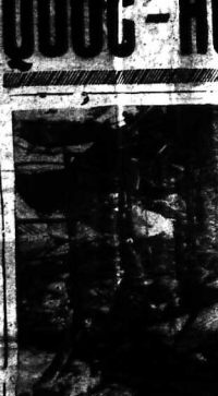
Hoạt động của một đơn vị quân đội...

AN TRẠNG... 6 ĐIỂM... VĨNH THẬP... trình bày trước H.B.D.