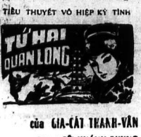
Tiêu Thuyết Vô Hiệp Kỳ Tinh