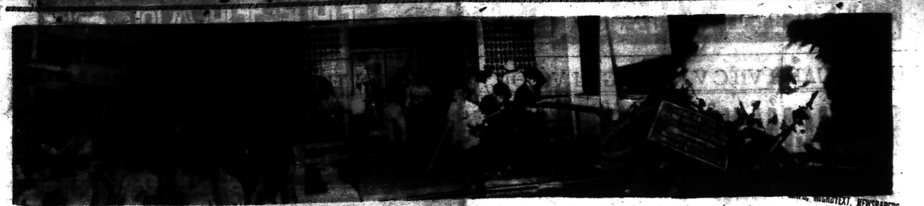
TỪ TRÁI QUA PHẢI: (1) ĐOÀN BIỂU TÌNH TIẾN TỚI TRƯỚC TÒA LẠNH SỰ PHÁP (2) TIẾN VÀO TÒA ĐẠI SỨ (3) VÀ ĐÓT MỘT SỐ XE GẮN MÁY (XEM TIN TRONG SỐ NÀY)