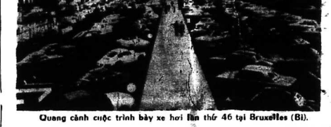
Quang cảnh triển lãm xe hơi lần thứ 46 tại Bruxelles (B).

Tính các công nghệ của những bộ quân phục Hiện nay chúng tôi giới thiệu một số bộ quân phục mới nhất, được thiết kế với tính năng hiện đại và tiện lợi.