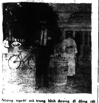
Những người mù trong hình đang đi đứng rất vững vàng khiến các khách qua đường ngạc nhiên quay lại coi.

...nhưng lại là một công trình nhân đạo. Những chiếc máy này có thể đọc sách bằng cách dùng ngón tay để chạm vào các chữ nổi trên trang giấy. Những chiếc máy này có thể đọc sách bằng cách dùng ngón tay để chạm vào các chữ nổi trên trang giấy.