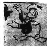
Một nhân vật nổi tiếng của Walt Disney - chú vịt Donald

65 năm cuộc đời, đã trở thành một nhân vật huyền thoại trong thế giới điện ảnh. Ông đã tạo ra một thế giới mới, một thế giới mà ở đó, những nhân vật hoạt họa sống động như thật. Ông đã tạo ra những nhân vật hoạt họa mà chúng ta vẫn còn nhớ mãi: Mickey Mouse, Donald Duck, Snow White, Cinderella, Sleeping Beauty, và hàng loạt nhân vật khác. Ông đã tạo ra những phim hoạt họa mà chúng ta vẫn còn nhớ mãi: Mickey Mouse, Donald Duck, Snow White, Cinderella, Sleeping Beauty, và hàng loạt nhân vật khác.