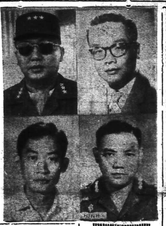
Một từ báo Algérie