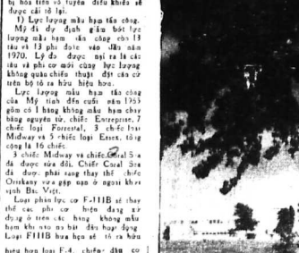
Phụ tá Hủy Kế hoạch Chiến Lược SAC (Strategic Air Command) ở căn cứ hàng không...