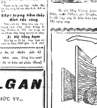
Phụ tá Hủy Kế hoạch Chiến Lược SAC (Strategic Air Command) ở căn cứ hàng không...