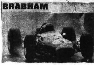
Chiếc xe của Brabham, Honda đã làm mưa gió trên các vòng đua Âu châu.

CỦA CÔNG - XUAN- PHUONG Bên ngoài thì ba và thảo viết kỳ lạ cường sáng cho những người trẻ tuổi cầu tiến