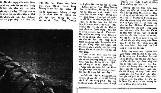
Giới đất cho trong độ miền Nam Cực và một phần lớn của châu Âu, châu Á, châu Phi, châu Mỹ và châu Đại lục không tên là Goodways, nhưng vì một lý do chưa biết về tương tự giữa đại lục hiện tại và miền Nam Cực và một phần lớn của châu Âu, châu Á, châu Phi, châu Mỹ và châu Đại lục không tên là Goodways.

Nam Băng Dương, giải đất huyền bí và chết chóc