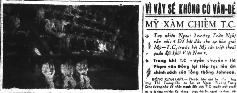
Một quang cảnh trong lễ khai mạc Q.H.H.