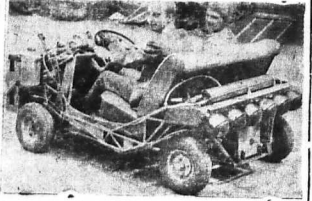
Thiết bị radar mới có tên là "M100".

Quân đội Mỹ đang nghiên cứu một loại radar mới có tên là "M100". Loại radar này có kích thước nhỏ hơn nhiều so với các loại radar thông thường. Nó có thể được lắp đặt trên các thiết bị quân sự, hoặc thậm chí là trên các phương tiện vận tải. Loại radar này có thể phát hiện các mục tiêu ở khoảng cách xa, và có thể theo dõi các mục tiêu này trong một thời gian dài. Nó cũng có thể được dùng để phát hiện các mục tiêu tàng hình.