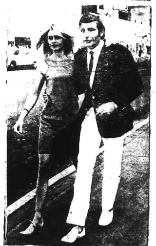
Đem tay nhau... lang thang tại Las Vegas của S. Sachs và B. Bardot

Viết tắt áo tắm B.B trở thành bà Sachs nhưng cũng vì chiếc áo tắm Sachs trả lại tên cho B.B. Liê cô như là tên hoa đào của ai cũng biết. Bà Sachs, Brigitte Bardot, người đã làm cho thế giới biết đến cái tên «tiếng sét ái tình» của mình. Bà Sachs, Brigitte Bardot, người đã làm cho thế giới biết đến cái tên «tiếng sét ái tình» của mình. Bà Sachs, Brigitte Bardot, người đã làm cho thế giới biết đến cái tên «tiếng sét ái tình» của mình.