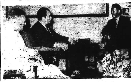
Chủ tịch «câu lạc bộ hòa bình» đề nghị 1

★ Trung Cộng: «Hội nghị ngoại trưởng ở Vong Các đang thực hiện một cuộc liên minh quân sự «phản cách mạng» rộng lớn» ★ VONG CÁC (AP) - Ngoại trưởng Phi Luật Tân Narciso Ramos hôm chiều nay tuyên bố là 17 quốc gia ở châu Á đang họp tại Vong Các để tìm cách chấm dứt chiến cuộc VN. Ngoại trưởng Ramos đã tuyên bố với giới báo chí tại thủ đô Manila, sau khi tham dự hội nghị Bộ trưởng Hợp tác Á Châu (ABC). Ramos không nói rõ các nước nào được gọi là các nước đồng minh, nhưng ông nói rằng các nước này bao gồm các nước ASEAN, Trung Cộng, Ấn Độ, Pakistan, Nhật, Đài Loan, Trung Quốc, và các nước khác. Ông nói rằng các nước này đang cố gắng để tìm ra một giải pháp cho vấn đề Việt - Nam, và rằng họ đang thực hiện một cuộc liên minh quân sự để chống lại các nước đồng minh của Mỹ.