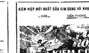
tiểu thuyết giản dị của NGƯỜI THỦ TÂM