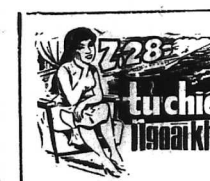
tiểu thuyết giản dị của NGƯỜI THỦ TÂM