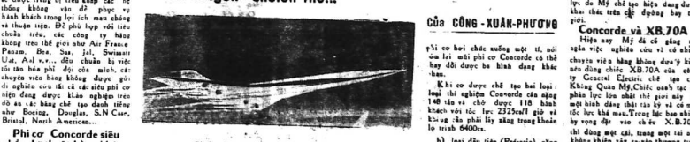
Chiếc phi cơ Concorde của Anh-Pháp.