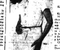
TRONG TRẮNG II

Quần áo của phụ nữ xưa khác với quần áo của phụ nữ nay về vấn đề đi làm... * NHIỀU BAN THANH NIÊN CÒ VỢ ĐI LÀM RỒI LAI THƯỜNG NGHĨ KHÔNG CHO VỢ ĐI LÀM MƯA: Ở NHÀ TÈ CHIA NỘI TRƯ CỘNG HƠN!