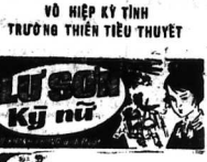
VỀ HIỆP KỶ TÌNH TRƯƠNG THIÊN TIỂU THUYẾT