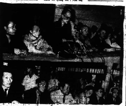
HÌNH TRÊN : Các vị khách mời của hội nghị tại Huế.

TRƯỜNG NGUYỄN TUYẾT THỰC VỀ TÌNH - THẾ MỚI L.T.S: Dạo này là mùa xuân tươi đẹp... T.T. Trí Quang nói rằng ông đã viết bức thư thứ hai gửi Tổng thống Hoa Kỳ và Đại sứ Cabot Lodge để nói về những vấn đề mà ông đang quan tâm.