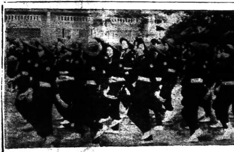
Đoàn người di tản ở vùng biên giới Việt Nam, một đội đoàn về cùng lực lượng quân đội đang chờ tiếp tế lương thực.

Ông Ngô Đình Diệm, chủ tịch Ủy ban Lãnh Đạo quốc gia, đã nói rằng ông không nhất thiết phải giữ đúng thời hạn công bố.