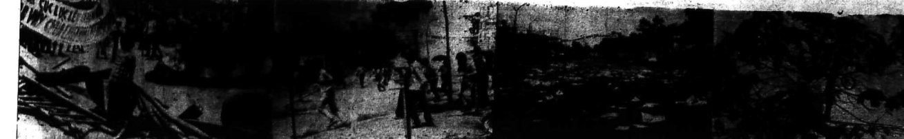
Giữa hỗn loạn và khói lửa, một thành viên Phật tử tên là Vũ Tấn Thường leo lên một cành cây để khẩu hiệu đã đảo cuộc dân ở miền Trung, rồi rút vào nhón toàn rạch bụng tự tử. Nhưng một số thành viên khác đã mau tay kéo anh xuống, khiến anh ngã xuống đất, thương tích đáng kể (hình chụp).