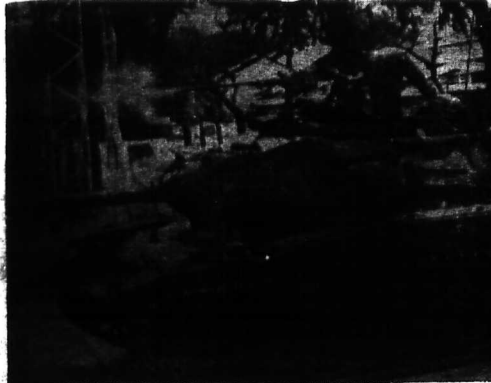
Các đặc phái viên Quyết Tiến theo dõi từng phút

MỘT SỐ PHI - CƠ MỸ ĐÃ RÚT KHỎI CÁN - CỨ ĐÀ - NẴNG Để tránh tai nạn vì biến cố ở nơi này! HOÀ THỊNH ĐỒN 22.5 (UPI).— Hôm thứ Bảy, Bộ quốc phòng Hoa Kỳ loan báo rằng một số phi cơ Hoa Kỳ đã rút khỏi cán - cứ Đà Nẵng vì đây có thể là nơi tiêu cho các cuộc bình tích của quân đội miền Nam Việt Nam. Phản ứng viên của Bộ quốc phòng Hoa Kỳ tuyên bố rằng các phi cơ của Mỹ ở Đà Nẵng chỉ để phòng ngừa, và không có ý định tấn công. Tuy nhiên, một số phi cơ của Mỹ đã bị bắn rơi ở Đà Nẵng.