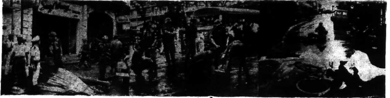
CHIẾN TRƯỜNG SAU KHI IM TIẾNG SÙNG. - Từ trái sang phải: Nơi Việt Cộng cho nổ mìn định hướng - Quân nhân Mỹ đang lượm vỏ đạn thu dọn chiến trường - Các người bị thương còn sót lại đang được chuyển đi.

Chủ nhiệm: HỒ VĂN ĐÔNG * Giám đốc chánh trị: ĐO BÀ THÈ * Tổng thư ký: THẠNH TRUNG * Phó thư ký: TRẦN VĂN SƠN