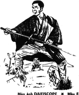
Màn ảnh DAIÉSCOPE * MÀN EASTMANCOLOR... PHỤ ĐỀ VIỆT, HOA, ANH NGỮ

HIỆP - SĨ MŨ NGHE GIÒ KIỂM (ZATOCHI)... PHIM MỚI CHIẾU LÊN TIỀN TÀI VIỆT NAM... MÀN ẢNH DAIÉSCOPE * MÀN EASTMANCOLOR