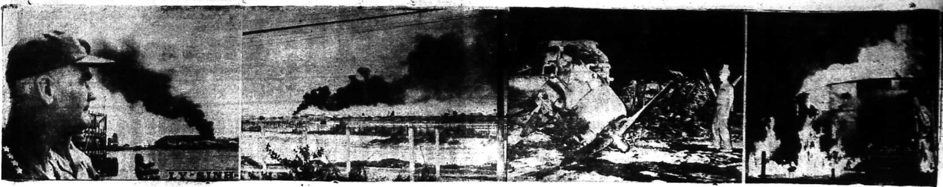
T. WESTMORELAND, TƯ LÍNH QUÂN ĐỘI MỸ Ở VIỆT NAM ĐANG QUAN SÁT CẢNH LỬA CHÁY TẠI PHI TRƯỞNG TẤN SƠN NHỨT SAU CUỘC PHÁO KÍCH CỦA V.C. (Xin xem tin đầy đủ trong số này).