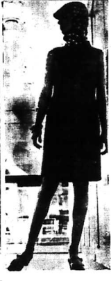
Viên ảnh tốt đẹp của Thuộc Viên