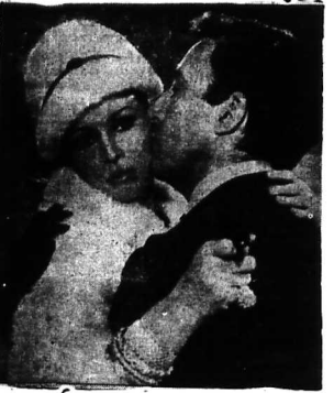
Ursula Andress ở Peter Sellers trong phim 'Casino Royal'

Những phim thuộc loại James Bond mà quý vị nhớ về với chúng gần đây đều là những chủ đề có chủ nghĩa ngoại chiến. Trong phim 'Casino Royal' ông James Bond được giao nhiệm vụ đưa một viên bom hạt nhân đến cho ông Fleming ở Cuba. James Bond là người ta này có tên là James Bond khác nhau với người anh họ khác của ông. Một điều đáng chú ý là ông Fleming sống ở Cuba trong năm 1965, người ta này có tên là James Bond khác nhau với người anh họ khác của ông. Một điều đáng chú ý là ông Fleming sống ở Cuba trong năm 1965, người ta này có tên là James Bond khác nhau với người anh họ khác của ông.