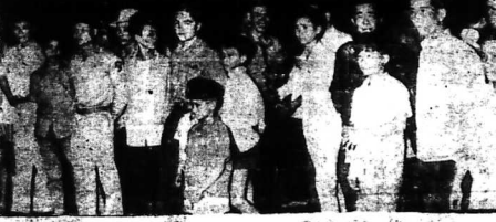
Đây là bức hình chụp hát 5 giờ sáng ngày 10-3. Các đồng đồng báo và đại diện báo chí đã kéo tới bình tình chế Bản Thanh... (text partially obscured)

HOA THINH ĐÔNG 10-3 (UPI). — Hôm nay, Ủy ban ngoại giao tại Thượng nghị viện Hoa Kỳ mở cuộc tham khảo về chính sách đối ngoại của Hoa Kỳ đối với Trung Cộng trong các năm 1965-1966.