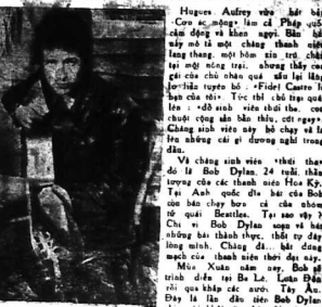
Bob Dylan tỷ phú... du dương