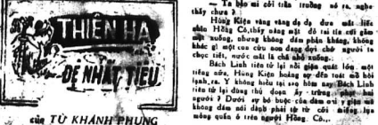
ĐỀ NHÃN TIÊU