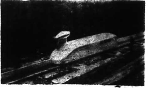
Chiếc xe lửa - phi cơ đầu tiên do người Mỹ chế tạo đang chạy trên đường rầy bằng, ở vùng...

* VỚI TỐC ĐỘ 190 CÂY SỐ 1 GIỜ, NGỒI TRÊN CHIẾC GỖ HƠI CÁCH ĐƯỜNG RẦY BÀNG (BỀ TON-S LY, NGUYỄN TÀ KHÔNG NHẢN RA XE ĐANG CHẠY