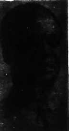
Ông N'Krumah đang trên đường đi thăm Bắc-N và Hà-Nội.