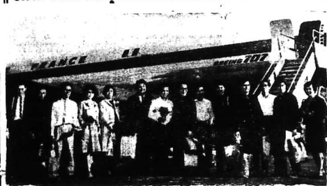
Chiêu 24-2, phái đoàn sinh viên Việt Nam 8 người thuộc «Hội nghiên cứu chính trị Đông Nam Á» đã rời Saigon về mục đích tìm hiểu tình hình VN. NHƯN (R) Đại diện phái đoàn Saigon và đại diện sứ quán Nhật tiếp rước với sinh viên tại Sân Sơn Nhữ.