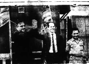
Một số công chức được hữu hiệu hóa