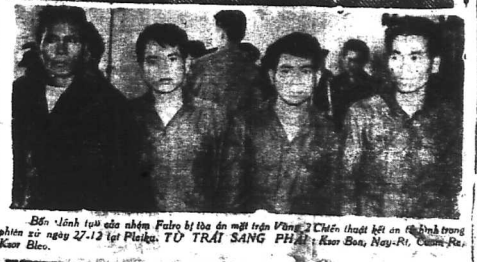
Bốn lãnh tụ của nhóm Fulro bị tòa án mới trên vùng 7 chiến thuật tại miền Trung...