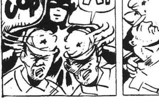
COM AI... (Còn nữa)