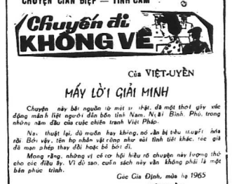
CHUYỆN GIẢN BIỆP - TÌNH CẢM... MẢY LỜI GIẢI MINH