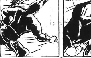
ĐÔNG HẢI TÊN LÍNH KHÁC C... BÂY GIỜ CÔN BÊN MÃ THẢ HỒ MÀ KỂ...