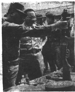
Nhà 28-9, Thủ tướng Nhật Hato đã tới thăm Bộ Tư-Lệnh quân Đai Hàn đang trị Di An. Một sĩ quan Đai Hàn đang trình bày Thủ tướng các loại vũ khí của quân Đai Hàn trước được của V.C. trong các cuộc đàm phán.