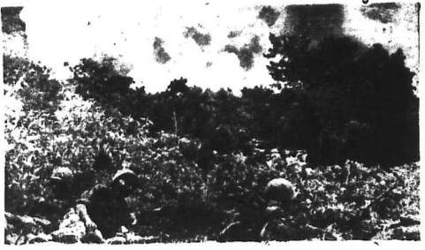
Một đơn vị bộ binh Hoa Kỳ đang phục kích V.C tại một địa điểm gần An Khê.

SAU LỜI CẢNH CAO CỦA NGOẠI TRƯỞNG MỸ SƯ ĐOÀN 325 CỦA B.V.