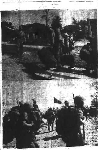
Thêm 1.200 TQLC Mỹ đã đổ bộ lên Chu Lai vào sáng 3-9-65 ở tỉnh Quảng Ngãi...