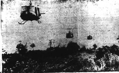
HOA THINH ĐÓN. Theo Roscoe Drummond, khi chiến tranh Việt Nam đến giai đoạn thương thuyết, chúng ta cần phải đề cao cảnh giác để tránh những lời làm hoang cảm bầy của đối phương. Nếu chúng ta phạm sai lầm thì hậu quả sẽ rất nặng nề. Tuy nhiên, chúng ta cũng cần phải có một chính thể có thể đi mà VN trở về một ngày nào đó.

1 Cộng Sản sẽ đòi một chính phủ 2 liên hiệp với những Bộ chủ yếu 3 TỐ CHỨC TUYẾN CỬ VỚI VANG KHI CHƯA CÓ THỜI GIẠN ĐỀ NGHỊ NGÔI VÀ XÂY DỰNG KINH TẾ XÃ HỘI Phải có bảo đảm quốc tế trong một cuộc tuyển cử tự do và nhất là nhân dân Bắc phải được tự do lựa chọn hai chế độ: Cộng sản hay Quốc gia