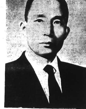
TỔNG-THÔNG ĐẠI-HÂN DÂN QUỐC PHÁC CHÍNH HY

1957 Đài Hân và Việt Nam đã có những cuộc đàm phán về các vấn đề liên quan đến Đại Hân.