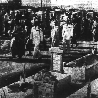
Hội 7 giờ 30 sáng ngày 11-8-65 để 18 Vũ Lan đã được Nhà nước Việt Nam chấp thuận để tiếp nhận quân đội tại Củ Chi.

* TÒA BẠCH ỐC VÀ BỘ NGOẠI GIAO MỸ: ĐÓ CHỈ LÀ MỘT SỰ LOAN TRUYỀN BẢNG QUỐ VÀ VỎ CÁN CỬ! HOA THỊNH ĐÓN (AFP) - Ngày 11-8, phát ngôn viên của Tòa Bạch Ốc đã từ chối không trả lời câu hỏi: nếu Chính phủ Việt Nam Cộng Hòa qua của Hoa Kỳ triệt thối quân đội làm Miền Nam thì Hoa Kỳ sẽ ra sao? Ông Bill Moyers, phát ngôn viên Tòa Bạch Ốc tuyên bố: Chúng tôi không có một chút bằng chứng nào để tin rằng chính phủ của ông Cabot Lodge tại Sài Gòn đã tuyên bố rằng: quân lực Hoa Kỳ sẽ được rút khỏi Việt Nam ngay cả trong trường hợp chính phủ Việt Nam Cộng Hòa sụp đổ. Ông Bill Moyers, phát ngôn viên Tòa Bạch Ốc tuyên bố: Chúng tôi không có một chút bằng chứng nào để tin rằng chính phủ của ông Cabot Lodge tại Sài Gòn đã tuyên bố rằng: quân lực Hoa Kỳ sẽ được rút khỏi Việt Nam ngay cả trong trường hợp chính phủ Việt Nam Cộng Hòa sụp đổ. Ông Bill Moyers, phát ngôn viên Tòa Bạch Ốc tuyên bố: Chúng tôi không có một chút bằng chứng nào để tin rằng chính phủ của ông Cabot Lodge tại Sài Gòn đã tuyên bố rằng: quân lực Hoa Kỳ sẽ được rút khỏi Việt Nam ngay cả trong trường hợp chính phủ Việt Nam Cộng Hòa sụp đổ.