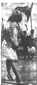
Mylena Demogod, đầu nổi tiếng của Pháp hiện đang nghỉ ngơi tại một khách sạn ở Bá Linh.