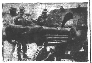
Đại Tá chỉ huy pháo đội Tân Tây Lan đang hướng dẫn Thống trưởng Westmoreland quan sát 1 khẩu đại bác 105 tấn của Tân Tây Lan tại căn cứ vùng Biên Hòa (Pháo đội Tân Tây Lan mới tới VN đã hợp lực với quân lực VN)

8 trang ĐỒNG NGUYỄN VĂN THƯỜNG ĐIỆP của TT Ng-Cao-K