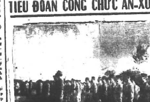
Tiểu-Đoàn Công-Chức An-Xuyến đang biểu lễ trình diễn.