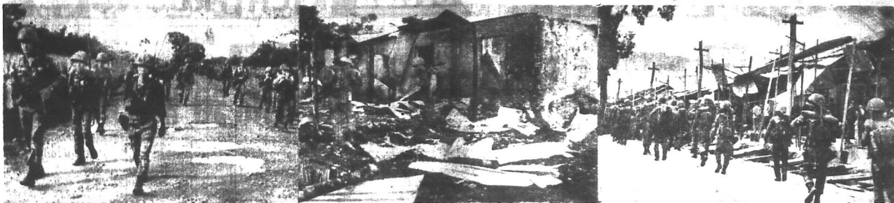
Từ TRAI SANG PHẢI: 1) Quân đội VNCH đang hành quân tái chiếm quận Dakto 2) Quang cảnh quận Dakto sau trận đánh. 3) Quân đội đang tiến qua phi xa Dakto giữa 1 quang cảnh tiêu điều vì chiến cuộc

DEPT. OF NEWS PICTURES NEWSPAPERS SEP 28 1965 CONSUL GENERAL