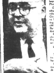
O. HERMAN KAHN

10 hay 20 sư đoàn Mỹ có thể phá tan bất cứ cuộc tấn công nào của Cộng Sản, chiếm cực Bắc-Việt và bình định toàn cõi Việt-Nam?