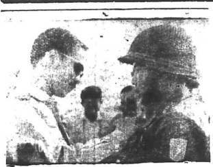
Thiếu Tướng Chủ Trì Ủy Ban hành pháp vùng trung đông sơn phòng