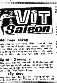
Một triệu chứng

Sinh viên Đại Hàn lợi biểu tình chống THỎA ƯỚC NHƯU - HÀN