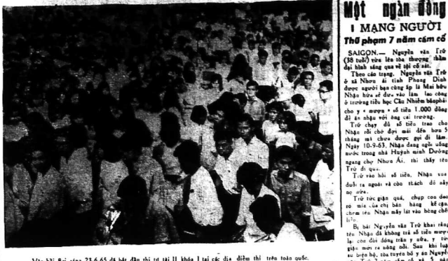
Vào hội nghị sáng 23-6-63 để bàn thì thì II khóa I tại các địa điểm thì tòa án...