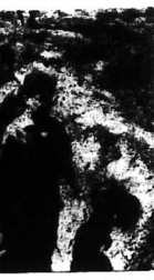
Đội khách trong lễ kỷ niệm 60 năm thành lập Trường Đại học Khoa học và Công nghệ Thủ Đức.

GIÁ-ĐÌNH 4 tên cướp vào nhà 1 người dân ở Thủ Đức... 60 nhà vật lý học ở thủ phủ của T.C.