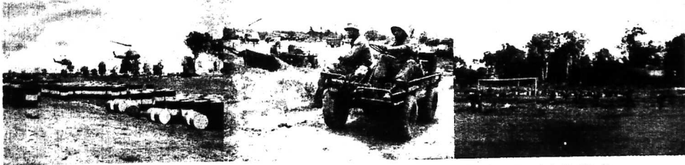
Tiểu đoàn 173 nhảy dù Mỹ sau khi đến phi trường Vinh, đã giao quân ở phía bắc phi trường chuẩn bị chiến đấu. HINH TRÊN 1: Phi cơ trực thăng của không lực Mỹ chuyển viện thêm đạn dược đến phi trường Phước Vinh. 2) Tiểu đoàn 173 nhảy dù Mỹ được phân bổ tiến sâu vào các rừng rậm tại Đông Xuân.