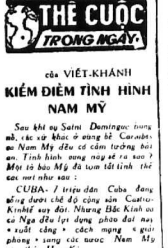
THE QUOC TRONG NGÀY KIỂM ĐỊNH HÌNH NAM MỸ

Sau khi về Sài Gòn... (Text describing military training and operations in Quang Chau province.)